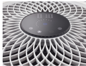
UVCA200 UV-C Floor standing air unit